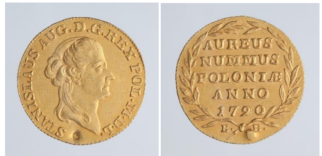
Zdj. 4. Dukat koronny, Warszawa, 1790, Muzeum Narodowe w Krakowie

Król Stanisław August Poniatowski to kolejny władca, który przeprowadził reformę monetarną – na przełomie 1765 i 1766 roku oparto się w państwie polsko-litewskim na nowym systemie monetarnym, zachowując przy tym tradycyjne jednostki pieniężne. Zmianie uległo tylko to, że zamieniono dotychczas używaną grzywnę krakowską na grzywnę kolońską. Postawiło to Rzeczpospolitą wśród państw posługujących się w mennictwie tzw. stopą konwencyjną.