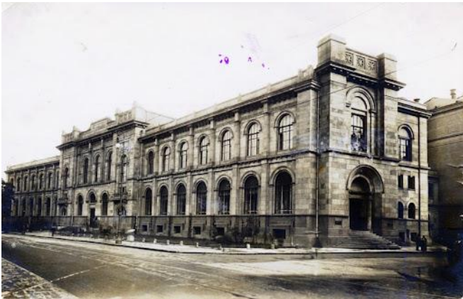
Zdj. 1. Historyczny budynek Reduty Banku Polskiego.

Istnienie banku centralnego bardzo silnie związane jest z polską państwowością i niepodległością - władze polskie już od 1918 roku, kiedy to po 123 latach nieobecności Polska ponownie zawitała na mapę Europy, dążyły do utworzenia Banku Polskiego. Ostatecznie ta instytucja, będąca prekursorem dzisiejszego Narodowego Banku Polskiego, powstała w 1924 roku.