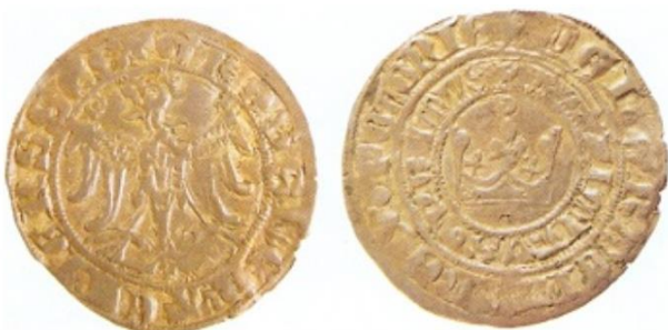
Zdj. 2. Grosz krakowski Kazimierza III Wielkiego

Twórcą jednej z pierwszych reform monetarnych, której efektem było ujednoczenie pieniądza w całym kraju był Król Kazimierz Wielki. Datuje się ją na lata 1365-1370.