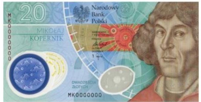
Zdj. 3. Banknot „Mikołaj Kopernik

Już 200 lat później pojawiła się kolejna postać, która miała bardzo duży wkład w rozwój ekonomii. Był to Mikołaj Kopernik, który w 1528 roku wygłosił ostateczną wersję „Rozprawy o biciu monet”, w której pisał o inflacji jako „psuciu pieniądza”. Tezy wypracowane przez Kopernika są uniwersalne i dotyczą polityki monetarnej oraz związanych z nią zjawisk również dzisiaj. Co ciekawe 9 lutego 2023 roku Narodowy Bank Polski wprowadził do obiegu banknot kolekcjonerski o nominale 20 zł „Mikołaj Kopernik”.